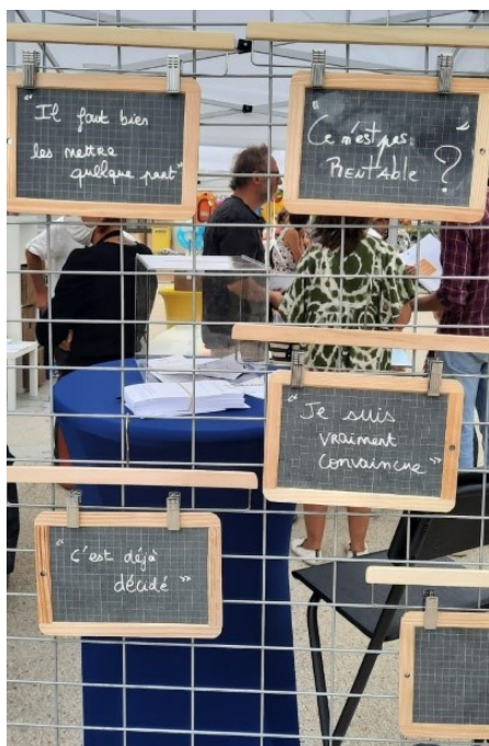
12 juillet 2021, extraits de paroles du public Saintes-Maries-de-la-Mer

« Je ne suis ni pour ni contre par principe. Mais je ne connais pas les effets sur les poissons et les oiseaux. L'outil est pourtant fabuleux. » un habitant des Saintes-Maries-de-la-mer