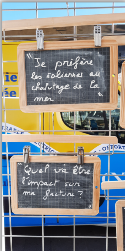
12 octobre 2021, les ardoises se remplissent sur la place

Ce n'est qu'après ce temps que les questionnaires sont remplis : des avis plutôt favorables, ce jour-là, mais avec des inquiétudes plusieurs fois entendues sur les conséquences d'un tel projet pour la facture d'électricité.