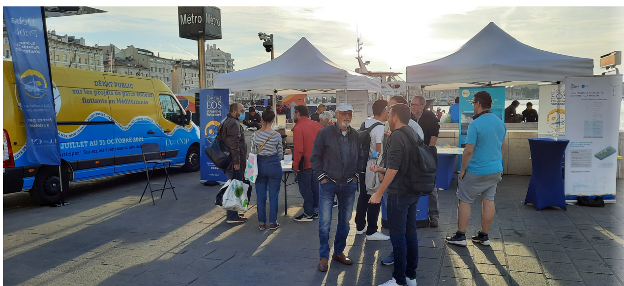
Le débat public, sur le Vieux-Port de Marseille