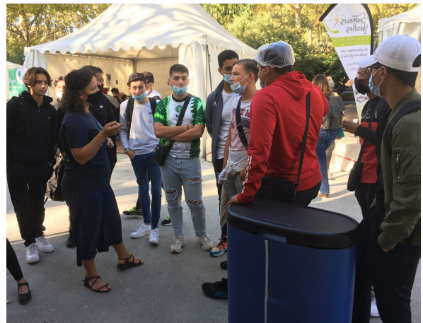
Les lycéen.ne.s du département très présent.e.s